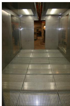
Gulvrister i arbejdsområdet