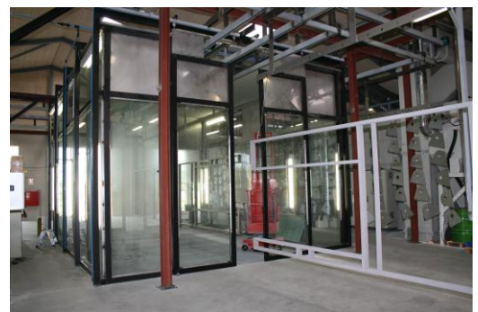
Den indtil nu største kabine til max. emne på 7m x 3m x 3m