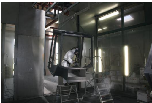
Kabine i drift